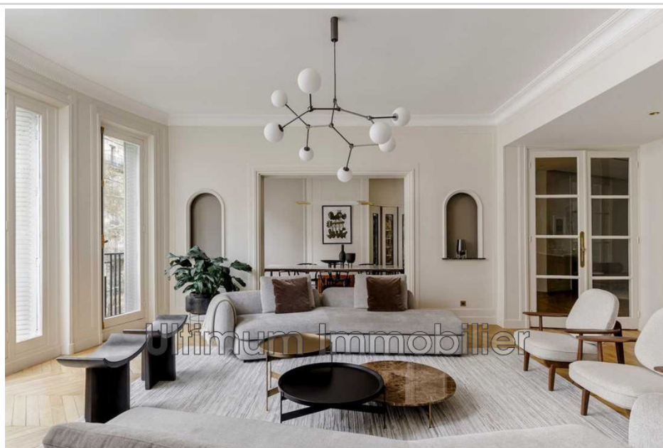
Appartement 2025017CV Nice